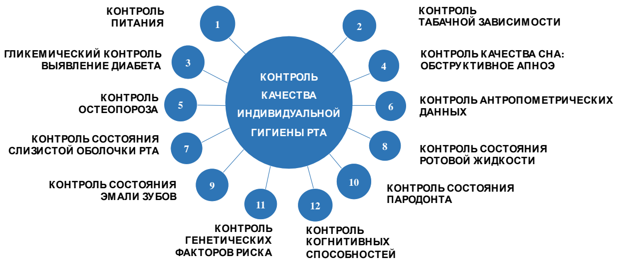
Рисунок 2 – Этапы выявления и контроля факторов риска стоматологических заболеваний

Индивидуальная программа первичной профилактики стоматологических заболеваний разрабатывается специалистом, исходя из комплексной оценки стоматологического статуса пациента с целью выявления факторов риска и досимптоматического прогнозирования развития стоматологических заболеваний. Для оценки эффективности такого подхода при разработке индивидуальной программы нами было проведено исследование 3 основных этапов выявления и контроля факторов риска стоматологических заболеваний: контроль антропометрических данных, контроль состояния эмали зубов и контроль качества индивидуальной гигиены рта.